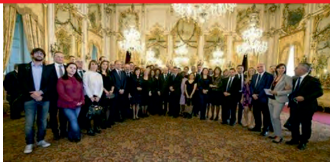
Visita al Quirinale insieme al Presidente Mattarella - Roma