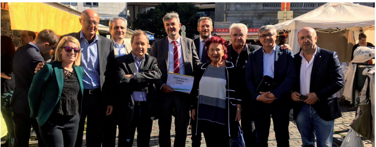
Incontri e visite guidate al Parlamento Europeo